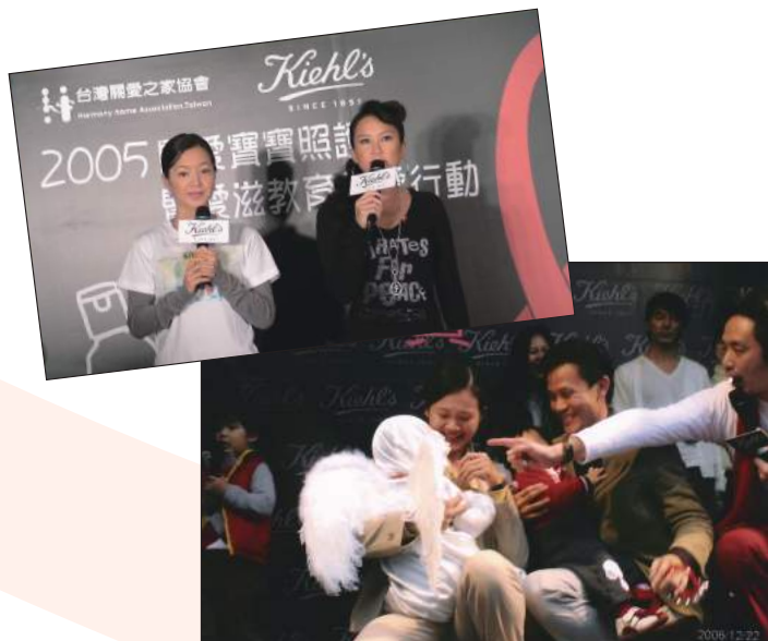
黛妃親身擁抱病患

相較於西方社會的菁英，如銀幕情人洛赫遜、舞國紅星紐瑞耶夫、網界高手艾許、籃壇神將魔術強森，三位必須用化名的感染者，能在台灣社會發揮防毒抗病的宣導力量嗎？社會上太多人仍然無知，也無心了解愛滋病，只一味地排斥和歧視感染者。而更具高度的風雲人物，為弱勢的愛滋病人代言，更能出來澄清觀念、撫慰病患家庭、提升覺醒的行動。