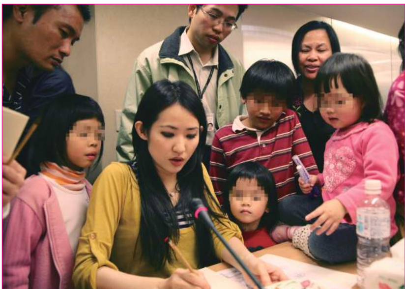
◆知名插畫家「王子麵」利用簡單的素材，教大家創作出大師級水墨畫作。