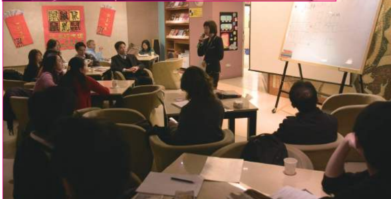
◆紀霖老師用「姓名學」來教大家輕鬆看個性，新年轉運來。